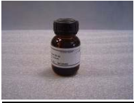
Primer 50ml (G790)