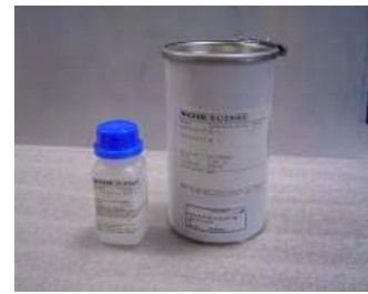
Art.Nr.: 34 100 410 = 1kg VE

Das Siliconmaterial ist nach dem Vulkanisieren in seiner chemischen Struktur unveränderlich. Daraus ergibt sich eine hervorragende Beständigkeit gegen Witterungseinflüsse und UV-Strahlung. Bestens geeignet für Flächenverklebung, auch strukturierte Gläser. Das RT 601 vulkanisiert zu einem glasklar transparenten, gummiartigen Material von sehr guter Reißfestigkeit. Die Glasoberfläche muss mit Primer (Art.Nr.34100450) vorbehandelt-grundiert werden. Für eine blasenfreie Verklebung ist eine Entlüftung im Vakuum erforderlich.