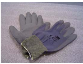
3M Schutzhandschuhe Handfit grau

Die Pumpe T8011 ZS bezeichnet eine Pumpe als Bausatz, das heißt es müssen sowohl die Luft- als auch die Stromanschlüsse selbst installiert werden und das aufgrund der Kühlung notwendige Lüfterrad mit einem Gehäuse geschützt werden.